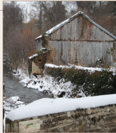
Moulin sur l'Arnon.

Charmante rivière prenant sa source en Creuse, l'Arnon serpente le bocage de la région. Ancrés au sein du paysage, le moulin de la Vie et le moulin du Vert jalonnent la rivière (deux propriétés privées). Le chemin de randonnée des Maîtres Sonneurs traverse le cœur du hameau du moulin de la Vie. Le moulin du Vert lui, est construit dans un site encaissé et la digue monumentale barre l'Arnon en créant un étang. Siège d'un fief important au Moyen Âge, le moulin était certainement fortifié par un château chargé de contrôler